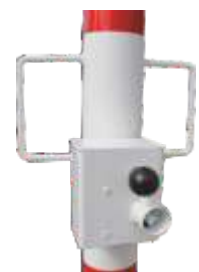
Schloßkasten für Schließung durch Dreikant oder Zylinderschloß Auch Kombination Dreikant und Zylinderschloß möglich