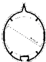
Antisitzprofil mit Nut aus Aluminium ALMGSI 0,5 Werkstoff EN-AW-6063