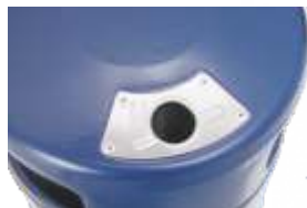
Detail optionaler Aschereinwurf

Volumen 40 Liter Ø 335 mm, Höhe 530 mm, Einwurflöcher 210 x 100 mm