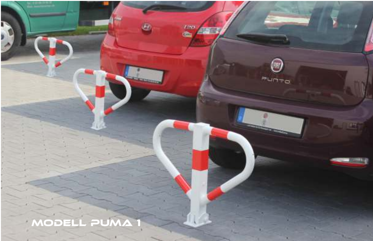
MODELL PUMA 1