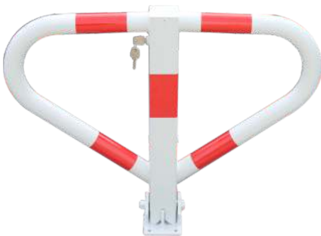
5.011-Zyl - mit Ø 48-er Bügelrohr