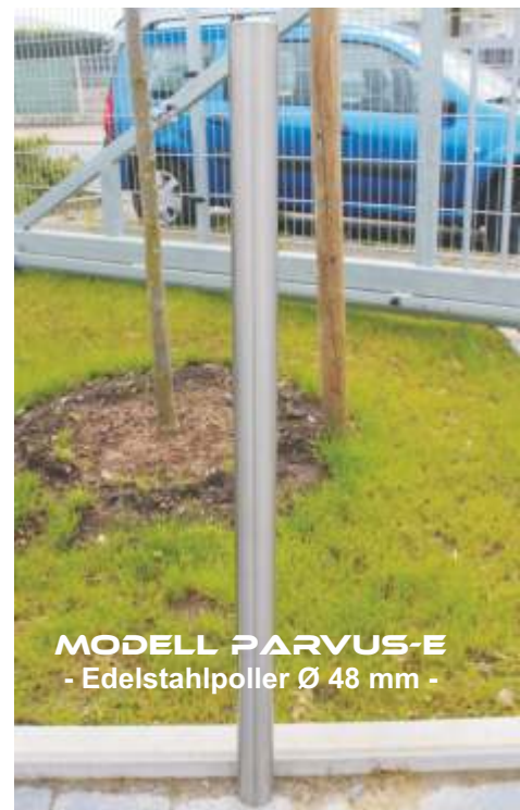
MODELL PARVUS-E - Edelstahlpoller Ø 48 mm -