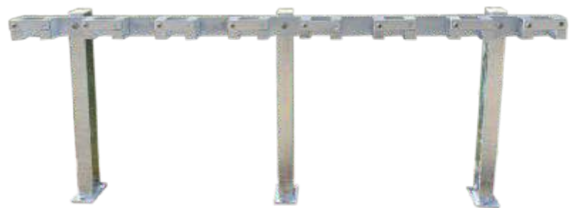
8-er Anlage zum Aufdübeln