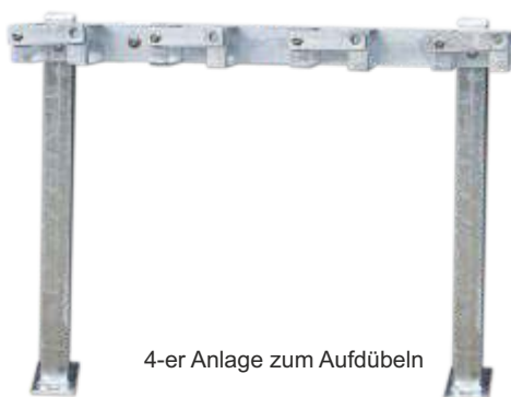
4-er Anlage zum Aufdübeln