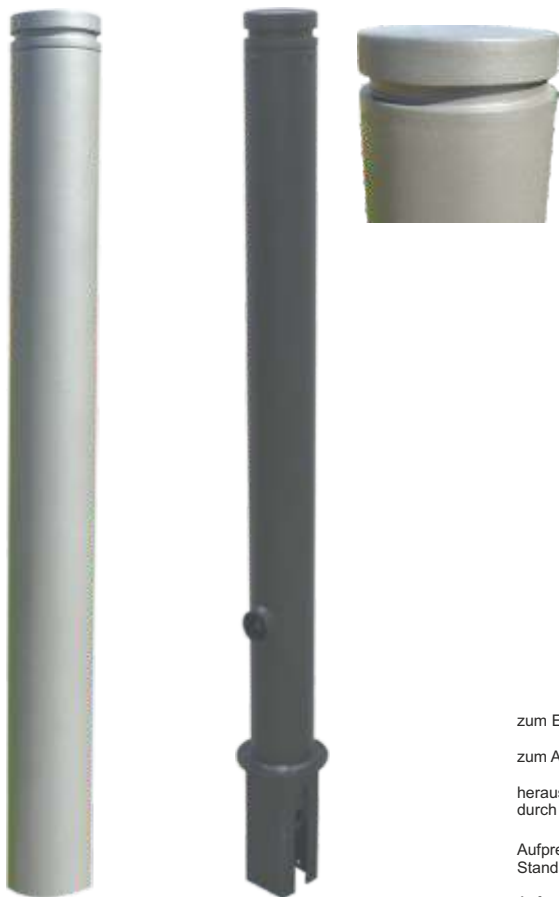
9.751Z mit RAL-Beschichtung