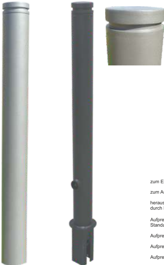
9.751Z mit RAL-Beschichtung