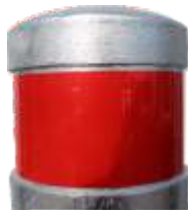
KOPENHAGEN - F -