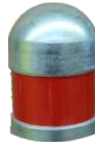
KOPENHAGEN - H -