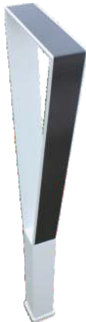
150165 plus 150166 Folie