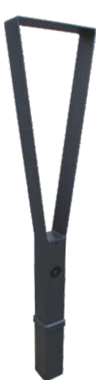
150165 plus RAL70 ( DB703 )