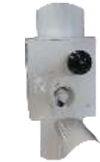
Schloßkasten für Schließung durch Dreikant