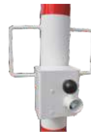
Schloßkasten für Schließung durch Dreikant oder Zylinderschloß Auch Kombination Dreikant und Zylinderschloß möglich