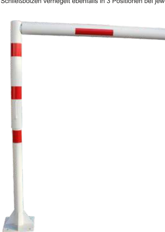
Beispiel für Schließung mit Steckbolzen