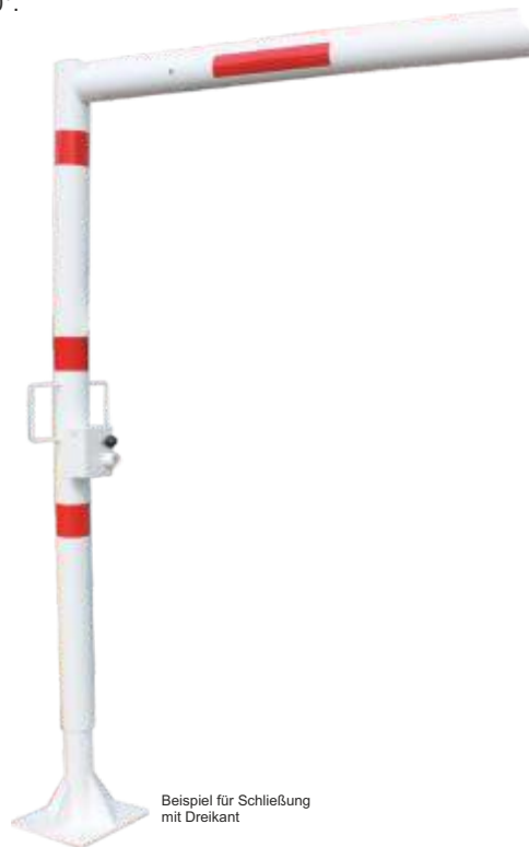
Beispiel für Schließung mit Dreikant