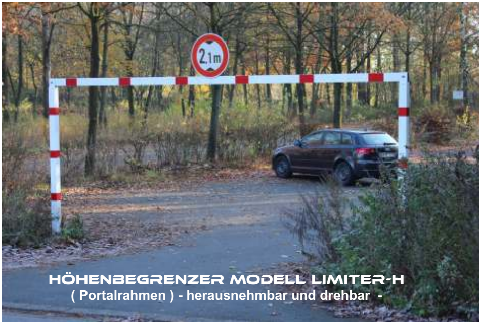
HÖHENBEGRENZER MODELL LIMITER-H ( Portalrahmen ) - herausnehmbar und drehbar -